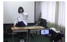
・放送室で司会する生活委員長 ・廊下で待機する候補者 ・スタジオで演説する候補者