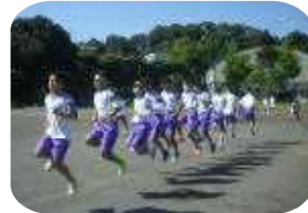
となったことに感謝申し上げます。

対中祭の2日間だけでなく、これまでの練習の取り組みの中で、対島中の良さである「全力で取り組む文化と豊かな団結力」を感じました。これからの学校生活にいかしていけることと思います。