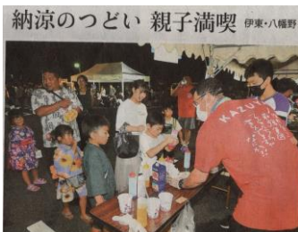
納涼のつどい 親子満喫 伊東・八幡野